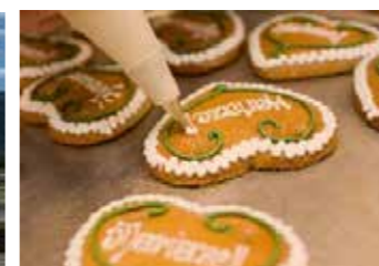
Lebkuchen aus Mariazell