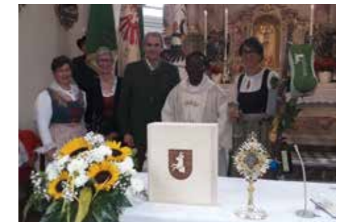
Pfarre Pettneu 15.08.2019