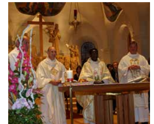
Pfarre St. Anton 25.08.2019