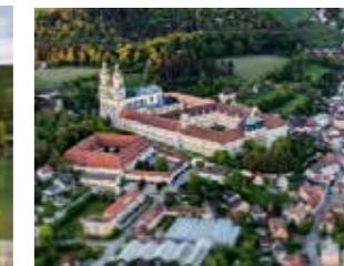
Stift St. Florian