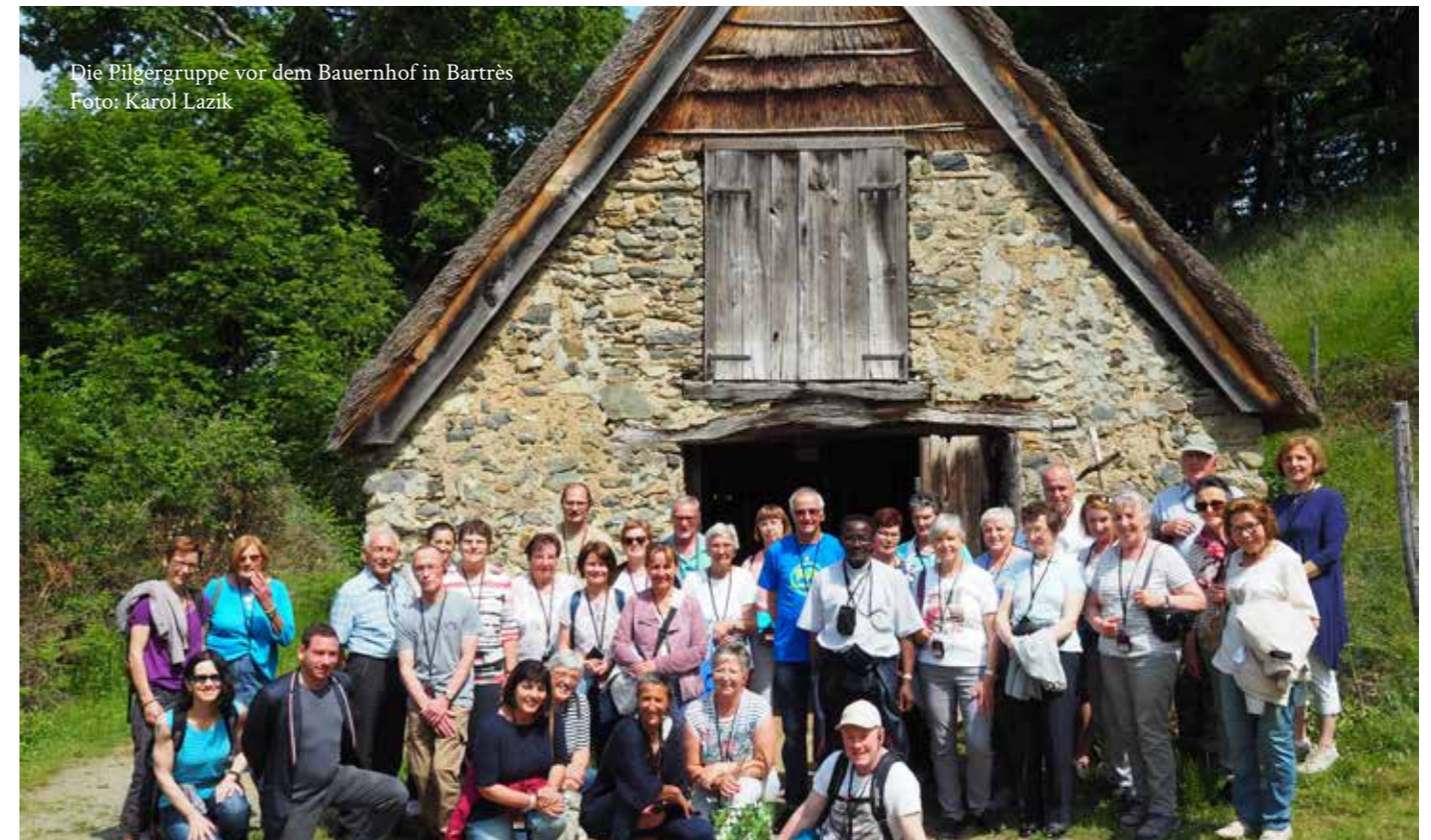
Die Pilgergruppe vor dem Bauernhof in Bartres

Der dritte Tag begann mit einer Führung durch Lourdes und anschließender Besichtigung des Geburtshauses der Hl. Bernadette. Nach der Hl. Messe in der „Chapelle St. Jean-Marie Vianney“ besuchten wir jene Grotte, an der Bernadette Soubirous (später die Hl. Bernadette) im Jahre 1858 mehrere Marienerscheinungen hatte. Jedes Jahr besuchen Millionen Pilger diese Gnadenstätte.