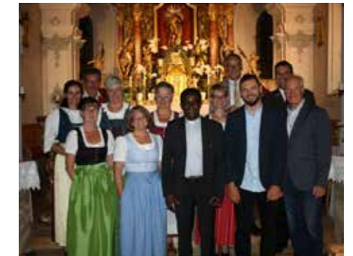
Pfarre Schnann 11.08.2019