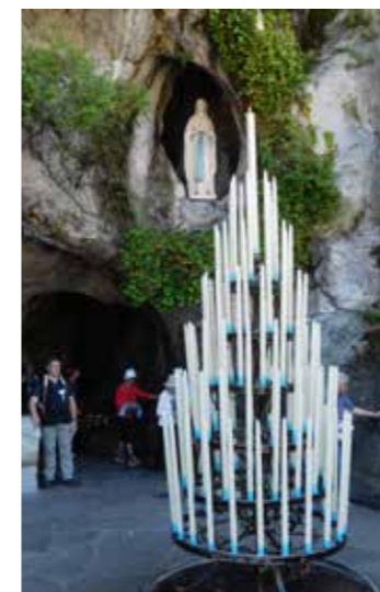
Die Erscheinungsgrotte

Die anschließende Führung durch die unterirdische „Basilika Pius X.“ versetzte uns in Staunen. Sie ist 191 m lang, 61 m breit und kann 25.000 Personen aufnehmen. Im Zentrum der Basilika steht der große Konzelsbrationsaltar, der von jedem Teilnehmer der Messe einsehbar ist. Nach der Besichtigung der „Basilika der unbefleckten Empfängnis“ (Obere Basilika) und der