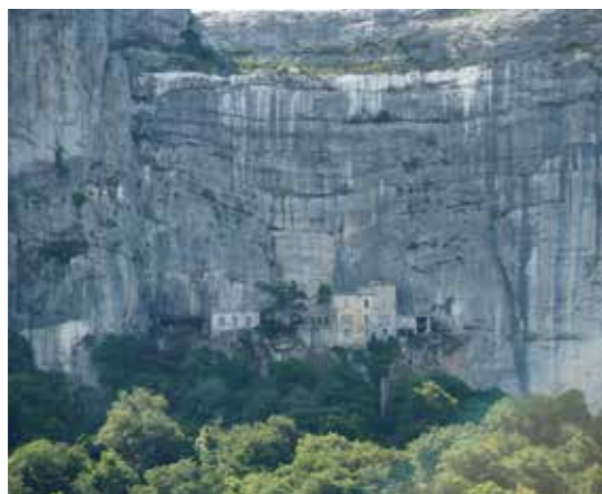
Die Höhle der Hl. Magdalena

Der fünfte Tag begann mit einer Hl. Messe in der „Chapelle Crux Gloriosa“. Es heißt Abschied nehmen von Lourdes. Während der Fahrt nach Carcassonne werden wir im Bus mit Kaffee verwöhnt. Carcassonne ist eine Festungsstadt, welche zu den beeindruckendsten und am besten erhaltenen Befestigungsbauten des Mittelalters zählt. Sie verfügt über eine doppelte Ringmauer mit 54 Türmen, ihre Cité ist nach wie vor bewohnt und zählt zum UNESCO-Weltkulturerbe.