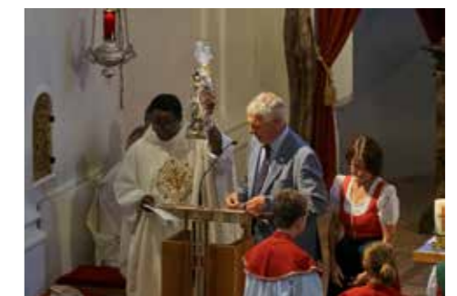
Pfarre St. Jakob 18.08.2019