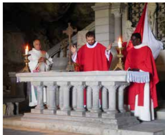
Hl. Messe in der Höhle der Hl. Magdalena

Nach dem Frühstück am sechsten Tag ging die Reise weiter in die Nähe von Saint Maximin de la Sainte-Baume zur Grotte der Hl. Magdalena . Dort soll Maria Magdalena 30 Jahr lang gelebt haben. Nach einer einstündigen Fußwanderung erreichten wir unser Ziel, genossen die herrliche Aussicht und feierten gemeinsam eine Hl. Messe.