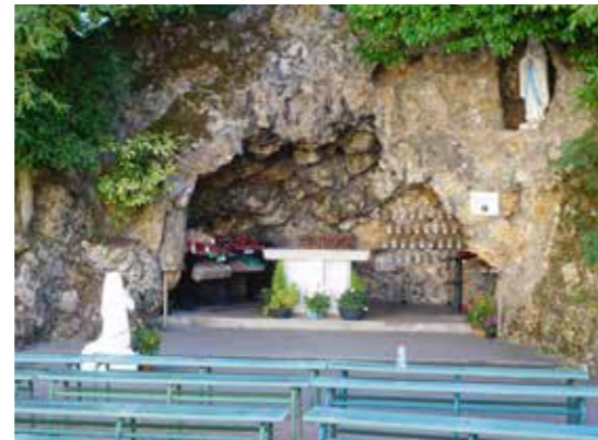
Grotte der Hl. Bernadette in Nevers

Die Reise begann am Freitag um 6:00 Uhr früh in St. Anton und führte uns durch die Schweiz nach Nevers , unserem ersten Aufenthaltsort. Auf dem Weg nach Nevers machten wir einen Zwischenstopp in Vézelay (Region Burgund) und besichtigten die Basilika Sainte-Marie-Madelaine. Die Basilika zählt seit 1979 zum UNESCO-Weltkulturerbe und ist seit 1998 Teil des Jakobsweges in Frankreich.