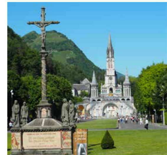
Die Obere und Untere Basilika

Nach dem Frühstück am vierten Tag wurde in einer Seitenkapelle der Rosenkranz-Basilika eine Hl. Messe gefeiert und die Pilgerkerze gesegnet. Der anschließende Ausflug führte uns „Basilika Notre Dame du Rosaire“ und zum Bauernhof in Bartres , wo sich Bernadette in ihrer Kindheit aufgehalten hat. Der Nachmittag stand zur freien Verfügung. Am Abend Teilnahme an der Lichterprozession, bei der eine zweite Pilgerkerze mitgetragen und gesegnet wurde.