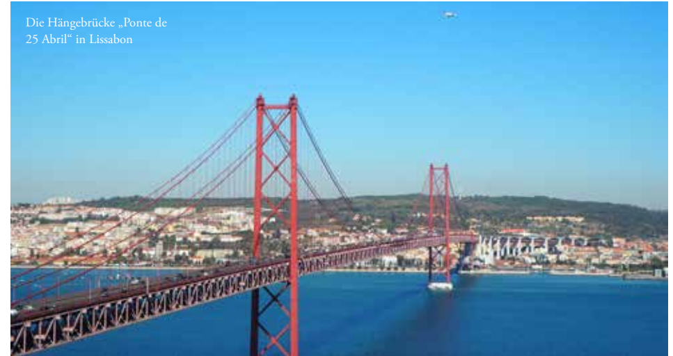
Die Hängebrücke „Ponte de 25 Abril“ in Lissabon