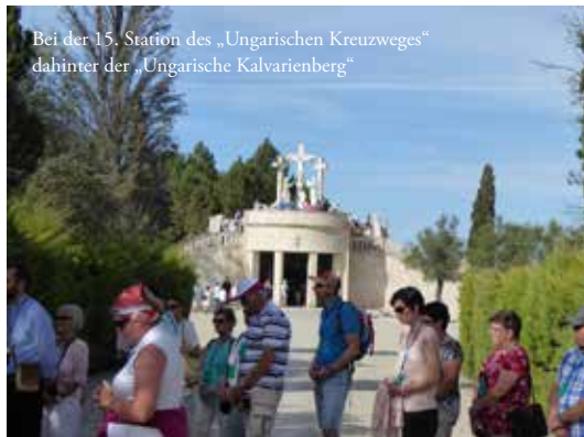
Bei der 15. Station des „Ungarischen Kreuzweges“ dahinter der „Ungarische Kalvarienberg“

Mit einer Frühmesse in Fátima begann der sechste Tag unserer Pilgerreise. Der restliche Vormittag stand zur freien Verfügung. Gegen Mittag verließen wir Fatima und fuhren nach Lissabon. Vorbei an der 17,2 km langen Schrägseilbrücke Ponte Vasco da Gama und über die berühmte Ponte 25 de Abril besichtigten wir die Christusstatue in Almada, von wo man einen herrlichen Ausblick auf die Atlantikhauptstadt genießen konnte. Vor dem Transfer zum Hotel blieb noch Zeit für die Besichtigung des Stadtzentrums und des Altstadtviertels.