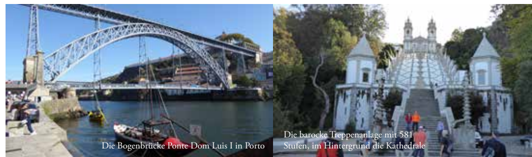
Die Bogenbrücke Ponte Dom Luis I in Porto