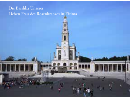
Die Basilika Unserer Lieben Frau des Rosenkranzes in Fátima

Am fünften Tag feierten wir mit tausenden Gläubigen eine Pilgermesse mit dem Bischof und zahlreichen Priestern aus allen Kontinenten. Anschließend fuhren wir zum Kreisverkehr der Heiligen Theresa von Ourém (Südlicher Kreisverkehr) und gingen den Ungarischen Kreuzweg . Die vierzehn Stationen des Kreuzweges wurden von ungarischen Katholiken, die auf der ganzen Welt verstreut sind, gespendet. Die 15. Station war ein Geschenk der ungarischen Gemeinde