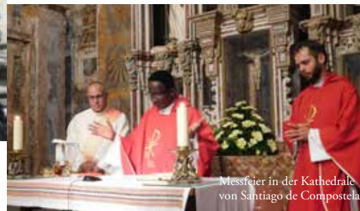
Messefeier in der Kathedrale von Santiago de Compostela

der Pilger nutzte nach einer kurzen Stadtführung und dem anschließenden Mittagessen die Möglichkeit einer Wanderung (ca. 6 km) auf dem Jakobsweg , der Rest unternahm eine ausgedehnte Stadtführung. Nach einer gemeinsamen Pilgermesse in der Kathedrale sowie einer anschließenden Führung durch das Gotteshaus blieb vor der Rückfahrt nach Braga noch Zeit für einen Kaffee.