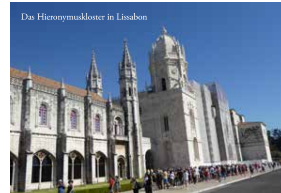
Das Hieronymuskloster in Lissabon