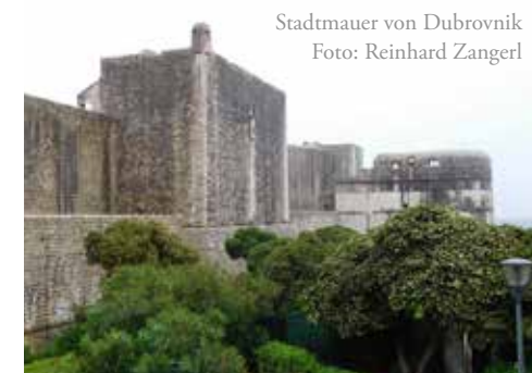
Stadtmauer von Dubrovnik

der Überlieferung zufolge Dubrovnik bei einem Angriff der Republik Venedig rettete. Die Stadt wurde während des kroatischen Unabhängigkeitskrieges 1991 von der Jugoslawischen Bundesarmee bzw. den serbisch-montenegrinischen Gruppen schwer beschossen und stark beschädigt; die Schäden sind heute zum Großteil wieder behoben. Die Stadtmauern von Dubrovnik (seit 1979 UNESCO-Weltkulturerbe) sind 1940 Meter lang sowie zwischen drei und sechs Meter breit und komplett begehbar. In der St. Blasius-Kirche wurde eine Hl. Messe gefeiert und anschließend hatte jeder Mitfeiernde die Möglichkeit, den Blasius-Segen zu empfangen.