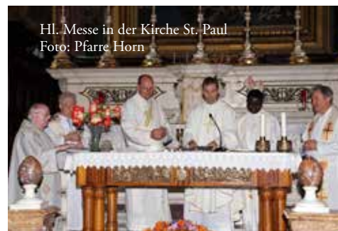
Hl. Messe in der Kirche St. Paul

Als dritter Höhepunkt unserer Reise stand der Inselstaat Malta auf dem Programm. Auf Malta soll der Hl. Paulus bei seiner Reise nach Rom Schiffbruch erlitten haben. In Rabat (Schwesterstadt der ummauerten alten Inselhauptstadt Mdina) wurden wir in die St. Agatha-Katakomben sowie die die St. Paul-Grotte geführt. In der Kirche St. Paul zelebrierte Vikar Karol gemeinsam mit seinen Mitbrüdern eine Hl. Messe. Nach einem kurzen Einkaufsbummel durch die geschichtsträchtige Altstadt von Valetta (Hauptstadt von Malta) fuhren wir mit dem Bus wieder zurück zum Hafen.